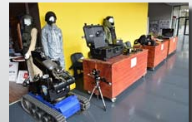
Prezentacije na Sajmu sigurnosti i prevencije