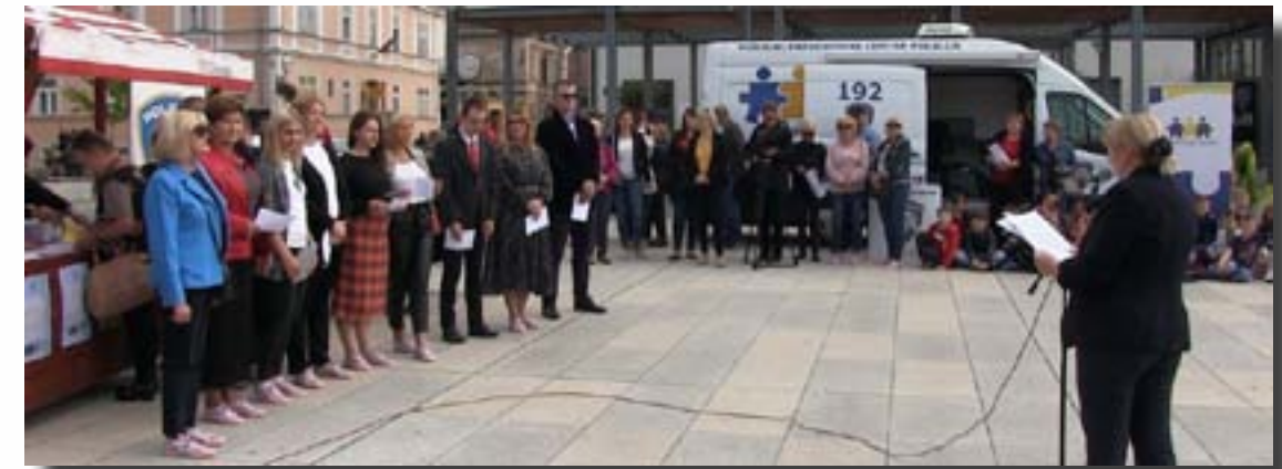
Izvođači recitala pod nazivom „Progovori“

Program je nastavljen tematskom izvedbom recitala pod nazivom „Progovori“, iza koje je Interventna policija PU varaždinske zajedno sa ženama izvela vježbu pod nazivom „Reagiraj“, kroz koju su bile prikazane tehnike samoobrane.